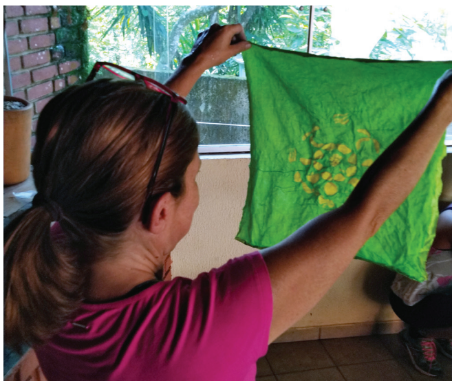
Elaine aceitou o desafio e se concentra na arte do batik. Toda orgulhosa, exibe seu trabalho.